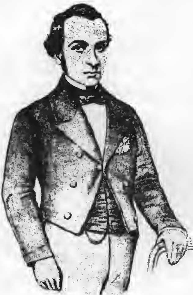
O Barão de Cotegipe (Gravura de Sisson).

corriam. Terra de Sol que se transformava em Terra da Luz e da Liberdade! Seguiam-lhe o exemplo o Amazonas e alguns municípios do Rio Grande do Sul. Apesar de todo esse movimento, o gabinete presidido pelo conselheiro Dantas adiou prudentemente a solução